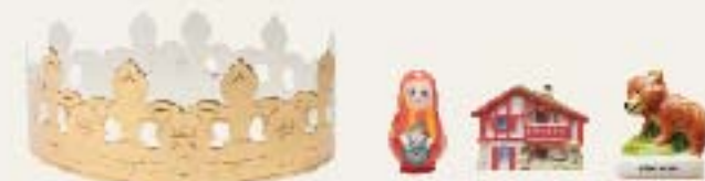
セット内容: ガレットデロワ、王冠、フェーヴ ※フェーヴは色々な種類がございます。