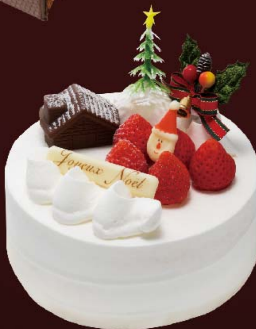
いちごシャンティ