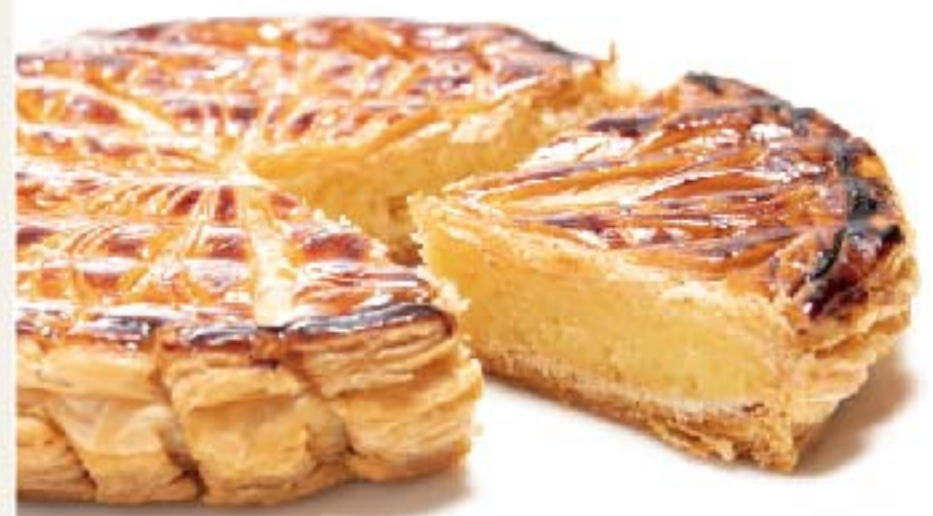
アーモンドクリームがサンドされたパイ菓子です

ガレット・デ・ロワは、1月6日の公現祭(こうげんさい)に食べられるフランス菓子のこと。フランスでは「ガレット・デ・ロワを食べないと一年が始まらない」と言われるほどの定番お菓子なんです!そしてこのお菓子の中には、一つだけ「フェーヴ(fève)」と呼ばれる焼き物が入っています。そのフェーヴを引き当てた人は「王(王女)」になることができます。その日は王冠をかぶり、皆から祝福され一年を幸せに過ごせるのだとか。お正月に皆さまで是非お楽しみください。