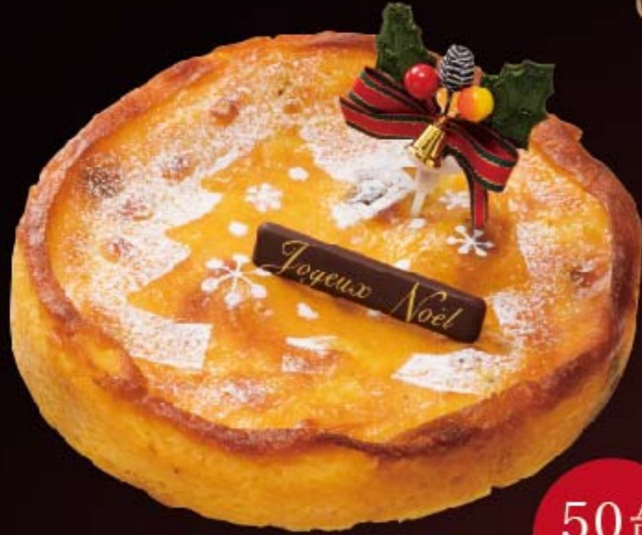
バイクドチーズケーキ